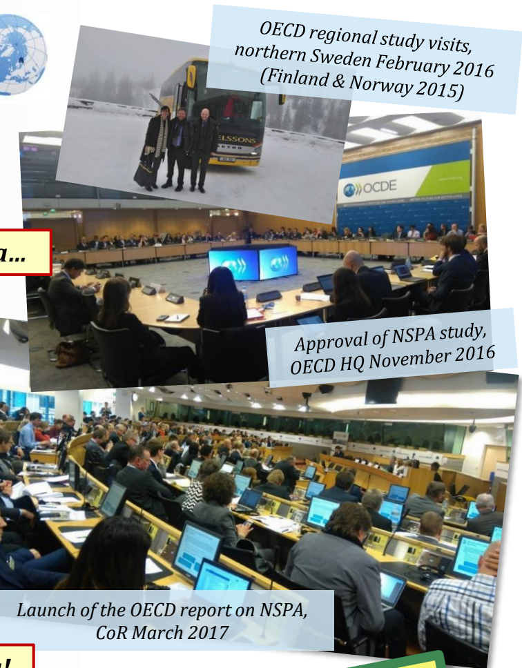
OECD regional study visits, northern Sweden February 2016 (Finland & Norway 2015)