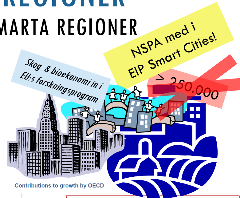
Contributions to growth by OECD

➤ Med rätt stöd är norra Sverige en testbädd för Europa!